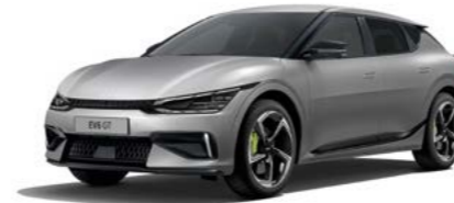
Moonscape Matt (KLM)