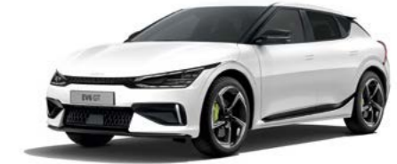
Snow White Pearl (SWP)