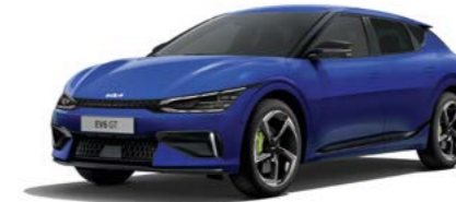
Yacht Blau Metallic (DU3)