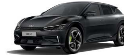
Auroraschwarz Metallic (ABP)