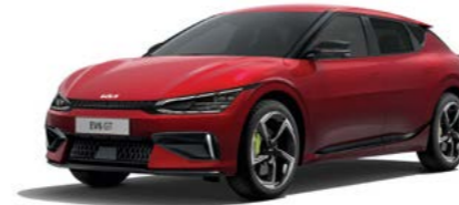
Runway Rot Metallic (CR5)

Der Kia EV6 GT ist so individuell wie du. Passe ihn deinem Stil an. Denn jedes Detail zählt.