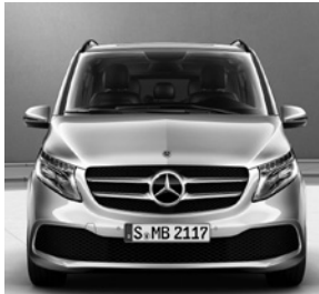
Sportfahrwerk (CF8) (Optional: AGILITY CONTROL Fahrwerk [CA1])