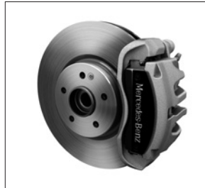
43,2 cm (17") Bremsanlage an der Vorderachse und Bremssättel mit „Mercedes-Benz“ Schriftzug