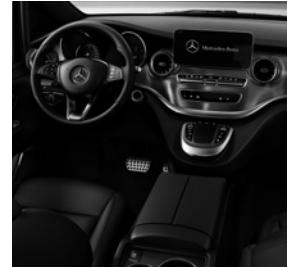
Mittelkonsole mit Kühlfach (FG6)