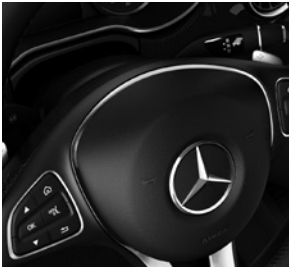
9G-TRONIC inkl. TEMPOMAT, DIRECT SELECT Wählhebel, Lenkradschalt paddles und DYNAMIC SELECT