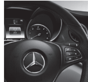
Multifunktionslenkrad Leder Nappa (CL3)