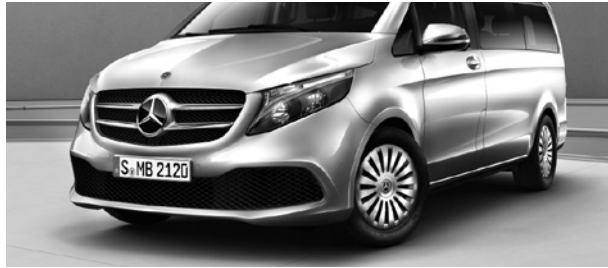
2-Lamellen-Kühlervorverkleidung in Silber glänzend