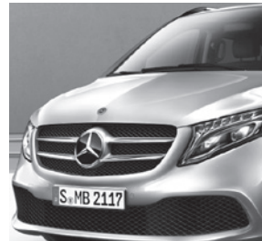
LED Intelligent Light System (LG2 + LG4)