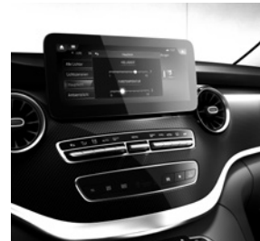
Zierelemente Carbonoptik (FB1) und Sportpedalanlage (YF3)