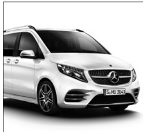
AMG Frontschürze und AMG Seitenschwellerverkleidungen