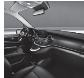
Leder Lugano (VX7/VX9), Zierelement Doppelstreifenoptik (F2Z)