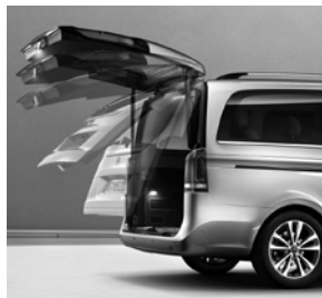
EASY-PACK Heckklappe (W68)