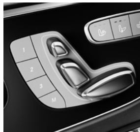
Fahrer- und Beifahrersitz elektrisch einstellbar (SF1/SF2)