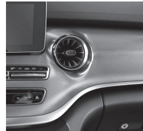
Zierelemente in gebürstetem Aluminium (FB2)