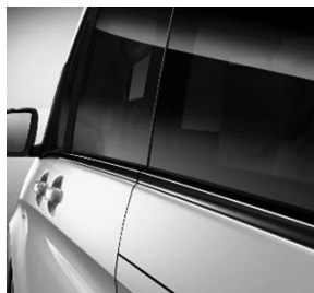
Bordkantenzierstab schwarz (FK5)