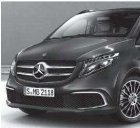
Chromzierstab im vorderen Stoßfänger

V-Klasse EXCLUSIVE (VQ8) und EXCLUSIVE EDITION (Z9G) (Auszug zusätzliche Serienumfänge ggü. V-Klasse AVANTGARDE EDITION [ZH8])