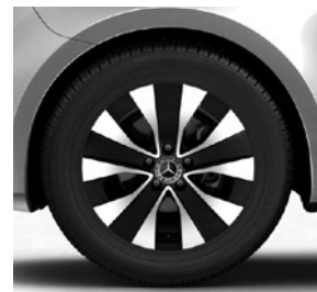
43,2 cm (17") Leichtmetallräder, schwarz, glanzgedreht, mit Bereifung 225/55 R 17 (R1N)