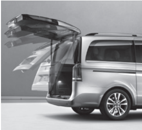
EASY-PACK Heckklappe elektrisch (W68)

V-Klasse AVANTGARDE EDITION (ZH8) (Auszug zusätzliche Serienumfänge ggü. V-Klasse AVANTGARDE [VQ1])