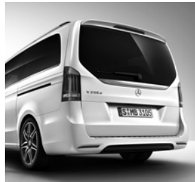
AMG Heckschürze 1) und AMG Abrisskante (FB4)