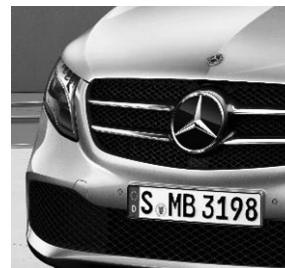
Kühlergrill schwarz lackiert (FK4)