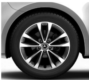
45,7 cm (18") Leichtmetallräder, tremolitgrau, glanzgedreht, mit Bereifung 245/45 R 18 (R1O)