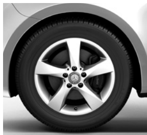
43,2 cm (17") Leichtmetallräder, vanadiumsilber lackiert, mit Bereifung 225/55 R 17 (RL8)