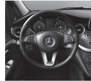
Multifunktionslenkrad Leder Nappa (CL3)