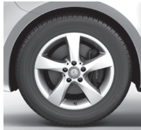
43,2 cm (17") Leichtmetallräder im 5-Speichen-Design, mit Bereifung 225/55 R 17 (RL8)