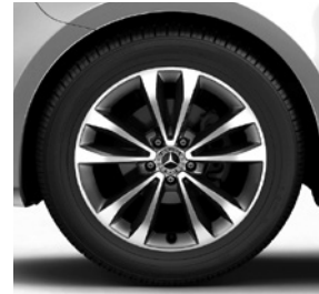
45,7 cm (18") Leichtmetallräder, 5-Doppelspeichen-Design, tremolitgrau, glanzgedreht, Bereifung 245/45 R 18 (R10)