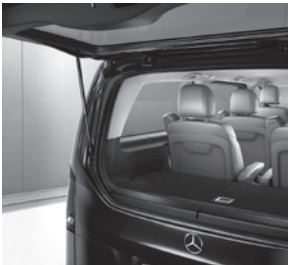
Separat zu öffnende Heckscheibe (W64)

V-Klasse AVANTGARDE (VQ1) (Auszug zusätzliche Serienumfänge ggü. V-Klasse)