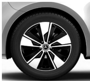
45,7 cm (18") Leichtmetallräder, schwarz, glanzgedreht, mit Bereifung 245/45 R 18 (R1P)