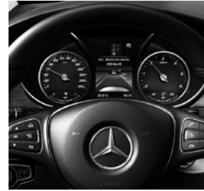
Active Distance Assist DISTRONIC (ET4)