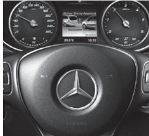
Fahrassistenz-Paket (JP2) mit u. a. Aktivem Brems-Assistenten (BA3) und PRE-SAFE® System (JP1)