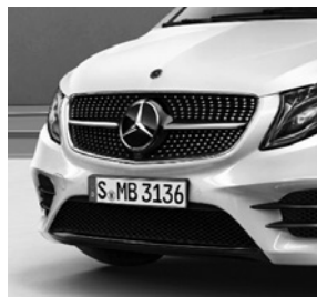
AMG Frontstoßfänger mit Zierelementen in Schwarz (C1L) 4)