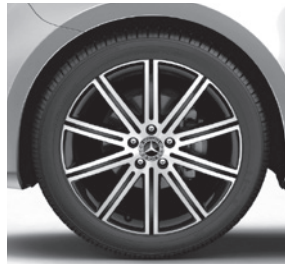
48,3 cm (19") Leichtmetallräder, 10-Speichen-Design, schwarz, glanzgedreht, mit Bereifung 245/45 R 19 (R1Q) 2)