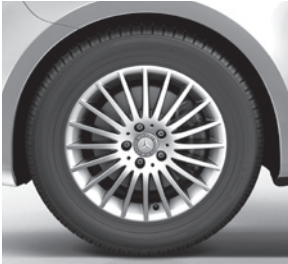
Sport-Paket Exterieur u. a. 43,2 cm (17") Leichtmetallrädern im 20-Speichen-Design, vanadiumsilber lackiert, mit Bereifung 225/55 R 17 (RK8)

V-Klasse EDITION (ZH7) (Auszug zusätzliche Serienumfänge ggü. V-Klasse)