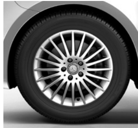
43,2 cm (17") Leichtmetallräder im 20-Speichen-Design, vanadiumsilber lackiert, mit Bereifung 225/55 R 17 auf 7 J x 17 ET 51 (RK8)