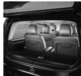
Separat zu öffnende Heckscheibe (W64) und Laderaumunterteilung (YG4)