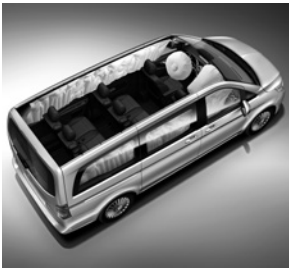
Windowbags für Fahrer, Beifahrer und im Fond (SH8)