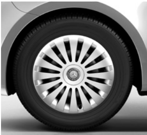
40,6 cm (16") Stahlräder mit Radvollabdeckung, mit 205/65 R 16 auf 6,5 J x 16 ET 52