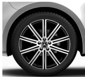
48,3 cm (19") Leichtmetallräder, schwarz, glanzgedreht, mit Bereifung 245/45 R 19 (R1Q)