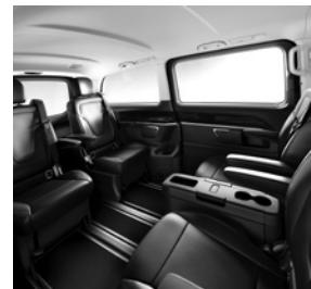
4 Einzelsitze im Fond