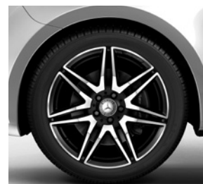
48,3 cm (19") AMG-Leichtmetall- räder, schwarz, glanzgedreht, mit Bereifung 245/45 R 19 (RK4)