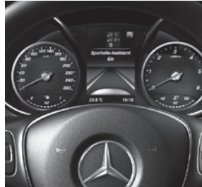
Spur-Paket (JP4) mit Totwinkel- (JA7) und Spurhalte-Assistent (JW5)

V-Klasse AVANTGARDE (VQ1) (Auszug zusätzliche Serienumfänge ggü. V-Klasse)