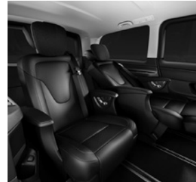
Luxussitze in Liegestellung