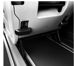
Sitzschienensystem mit Schnellverriegelung zum Ein- und Ausbau der Fondsitze