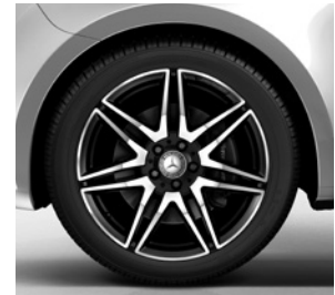
48,3 cm (19") AMG Leichtmetallräder im 7-Doppelspeichen-Design, schwarz glanzgedreht (RK4)