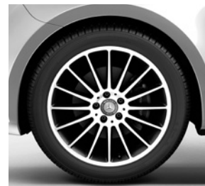
48,3 cm (19") Leichtmetallräder, schwarz lackiert, Front glanzgedreht, mit Bereifung 245/45 R 19 (RK3)