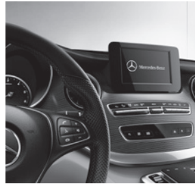
Zierelement Doppelstreifenoptik (F2Z)