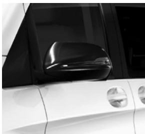
Fahrzeugspiegel in Schwarz lackiert (F3S)

43,2 cm (18") Leichtmetallräder im 5-Speichen-Design schwarz glanzgedreht (R1P) 6)