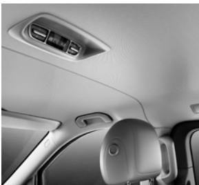
Klimatisierungsautomatik THERMOTRONIC (HH4) und Klima- automatik TEMPMATIC im Fond (HZ7)