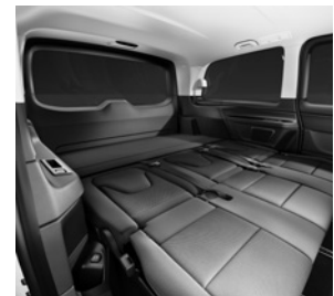
Liege-Paket inklusive 3er-Sitzbank als Komfortliege in der 2. Reihe (V9B)