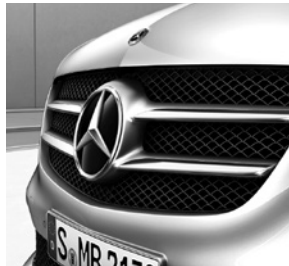
Luftinlass mit Mercedes Stern