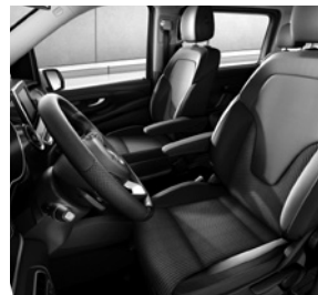
Polsterung Stoff Santos