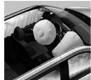
Airbags, Thorax-Pelvis-Sidebags und Windowbags für Fahrer und Beifahrer