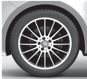
48,3 cm (19") Leichtmetallräder im 16-Speichen-Design, mit Bereifung 245/45 R 19 (RK3) 1)