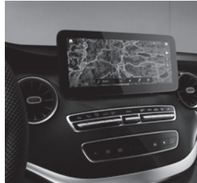
Navigation (E1E) mit Verkehrszeichen-Assistent (JA9) und Burmester® Surround-Soundsystem (E65)