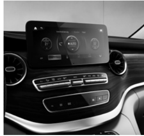
26 cm (10,25") HD-Touch-Display (E1F)