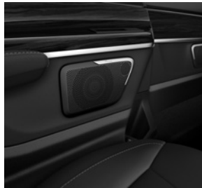
Burmester® Surround-Soundsystem (E65)