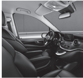
Komfortsitze in Leder Lugano in der Farbe Schwarz