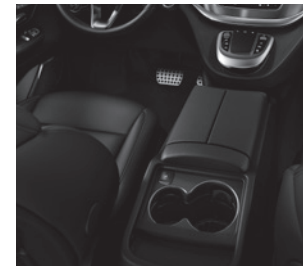
Mittelkonsole mit Kühlfach (FG6)