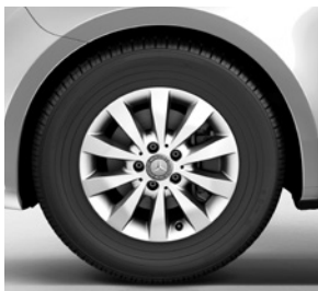
40,6 cm (16") Leichtmetallräder, vanadiumsilber lackiert, mit Bereifung 205/65 R 16 (RL5) 1)