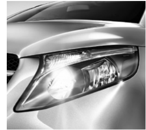
Reflexionsscheinwerfer mit Tagfahrlicht