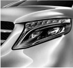
LED Intelligent Light System (LG2 + LG4)