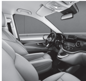
Komfortsitze mit Ziernaht in Leder Nappa in den Farben Schwarz, Seidenbeige oder Tartufo (VY7/V4T/VY9)