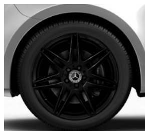
48,3 cm (19") AMG-Leichtmetall- räder, schwarz, mit Bereifung 245/45 R 19 (R1U)