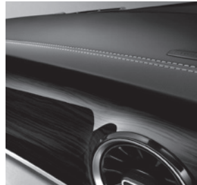
Zierelemente Holzoptik Ebenholz Dunkelathrazit (FH9) und Instrumententafel in Lederoptik mit Ziernaht