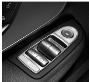
Fensterheber elektrisch 2-fach (mit Sonderausstattung 4-fach)