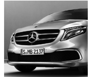
Chromzierstab im Stoßfänger