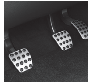
Sportpedale in Aluminium gebürstet (YF3)