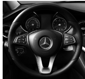
Multifunktionslenkrad im 3-Speichen-Design