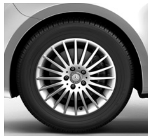
43,2 cm (17") Leichtmetallräder, vanadiumsilber lackiert, mit Bereifung 225/55 R 17 (RK8)