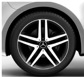
48,3 cm (19") Leichtmetallräder, schwarz lackiert, Front glanzgedreht, mit Bereifung 245/45 R 19 (RL3)